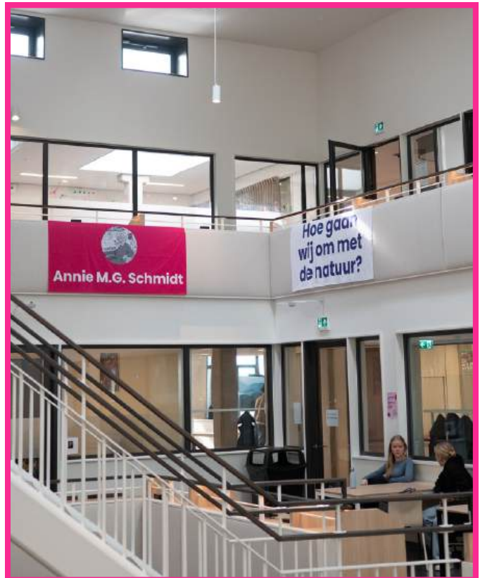
Elke unit heeft een eigen plek binnen de school die met vlaggen wordt aangegeven

Volgens Nicole vinden de vo-docenten het een verrijking om les te geven aan de junioren. "Zaken zoals groepsvorming en routines krijgen sterk de nadruk bij de junioren, dat nemen zij weer mee naar het vo. We versterken elkaar."