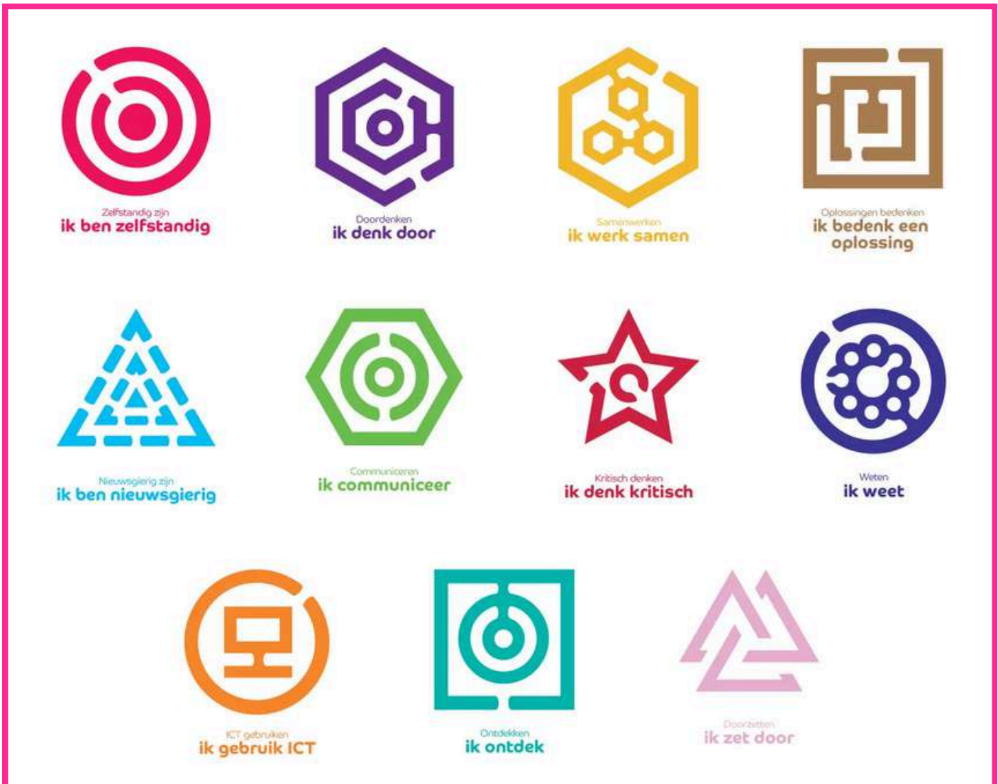
Bouwstenen van Perspectief 10-14